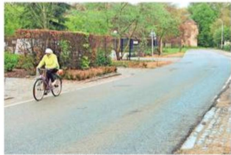
Ekeren wil een fietspad aanleggen aan het Laar, maar rekent daarvoor ook op geld van Infrabel. Dat komt er voorlopig echter niet.