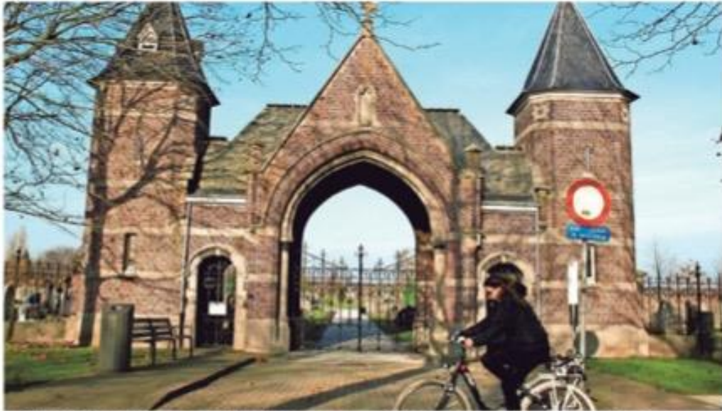
De historische toegangspoort tot de Ekerse begraafplaats zal gerestaureerd worden.

In het voorjaar van 2015 start de tweede fase van de restauratie van het historische poortgebouw op de Ekerse begraafplaats. Daarna kan het opnieuw de officiële toegangspoort worden van het kerkhof. Het einde van de werken is gepland tegen de zomer van volgend jaar.