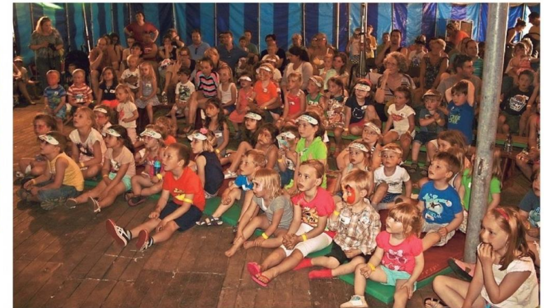
De kinderen zagen Jules zondag tot leven komen in het poppentheater.

één haartje voor elke dag van de week. Bovendien heeft hij een grote neus, want het mocht geen perfect ventje zijn. Kinderen vinden het net of wanneer een pop niet volmaakt is. Jules straalt neutraliteit uit, waardoor hij het vriendje van ieder kind kan zijn.